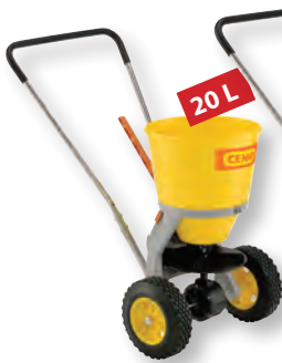
SW20 C Light